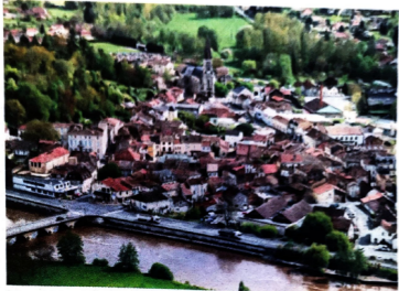
Mussidan a plusieurs projets pour améliorer son image notamment la rénovation de l'entrée de ville.

Saint-Aulaye-Pymouge et la Roche-Chalais, ainsi que Lalinde, Le Buisson-de-Cadoux et Beaumont-en-Périgord, ces cinq communes ont constitué deux projets pour le programme Petites Villes de demain. En tout, 19 communes du Périgord adossées à leur intercommunalité figurent sur la liste qui vient d'être publiée par le ministère de la Cohésion des territoires. On y trouve également (du nord au sud) Nontron, Brantôme-en-Périgord, Thiviers, Excideuil, Ribérac, Thenon, Terrasson-Lavilledieu, Montpon-Ménestérol, Mussidan, By-met, Issigeac, Pays-de-Belvès, Saint-Cyprien et Sarlat. Périgueux et Bergerac ont déjà fait partie d'un programme similaire baptisé Coeur de ville, où il y a un apport technique et des fonds d'aides (3 milliards d'euros sur six ans), concernant un millier de villes de moins de 20 000 habitants à travers la France.