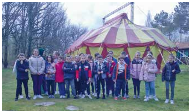
Les CM2 de l'école Émile Brugne en voyage.

Les élèves ont baigné dans l'univers d'Harry Potter : le livre des potions a permis d'acquérir du vocabulaire et d'effectuer des mélanges explosifs, les règles du Quidditch ont été vite acquises pour gagner en équipe. Ils ont aussi