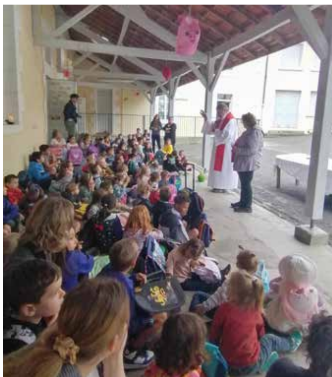
Bénédictio des cartables

Les premiers projets sont lancés... L'école c'est reparti ! Youpi !