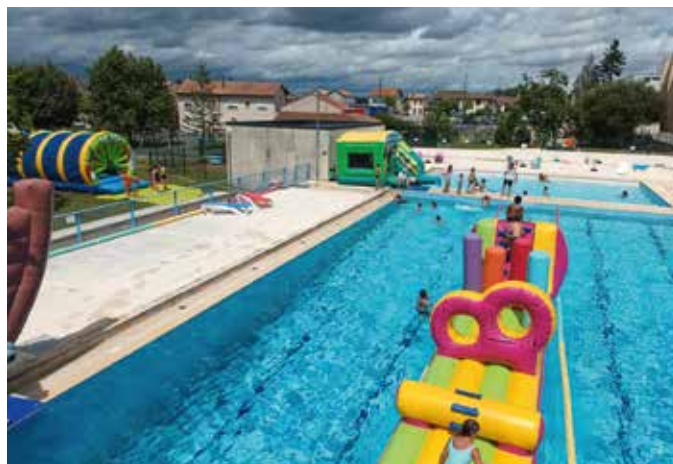
Fête de la piscine