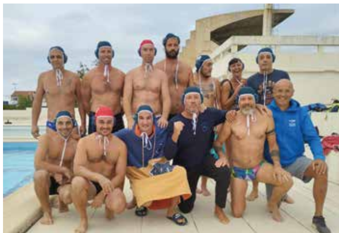
Équipe Water Polo