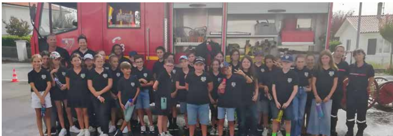
Les nouveaux élèves de 6 e du collège Jeanne d'Arc lors de leur journée de rentrée 2023.

Avec des effectifs encore en hausse, le collège Jeanne d'Arc a connu une rentrée dynamique. Après une matinée consacrée à la découverte de leur nouvel univers, les élèves de 6 e ont passé l'après-midi à la caserne des pompiers. Ces derniers les ont chaleureusement accueillis pour une visite instructive et un atelier de sensibilisation au secourisme.