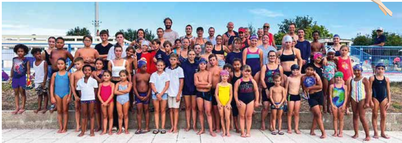
Club des nageurs La Roche-Chalais – Saint-Aigulin 2023.

Le club des nageurs a repris ses activités dès l'ouverture de la piscine. Sous l'impulsion du bureau des sports et des maîtres-nageurs, soutenu par les bénévoles de l'association, le club a rencontré un franc succès tout au long de l'été.