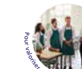
Pour valoriser ses équipes et son engagement