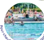
Pour chauffer la piscine municipale