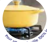
Pour un gaz de ville 100% local